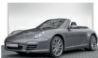
Porsche Zentrum Oldenburg

Porsche 911 Carrera 4 Cabriolet mit PDK , 254 kW (345 PS), EZ 05/10, 74.250 km, meteorgrau-metallic, Lederausstattung inkl. Sitze schwarz, ParkAssistent hinten, BOSE® Surround Sound-System, Telefonmodul, automatisch abdblendende Innen-/Außenspiegel mit integriertem Regensensor, dynamisches Kurvenlicht, Fußmatten, Navigationsmodul, Sitzheizung, Sportsitze, universelle Audio-Schnittstelle, Vorrüstung Vehicle Tracking System, 19-Zoll Carrera Sport Rad u. v. m., EUR 66.950,-