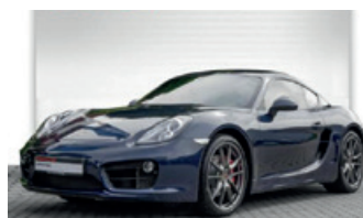
Porsche Zentrum Oldenburg

Porsche 718 Boxster S mit PDK , 257 kW (350 PS), EZ 05/16, 19.320 km, lavaorange, Lederausstattung inkl. Sitze schwarz, ParkAssistent vorne und hinten inkl. Rückfahrkamera, Navigationsmodul für PCM, Alarmanlage mit Innenraumüberwachung, Connect Plus, Porsche Active Suspension Management (PASM) inkl. 10-mm-Tieferlegung, Sportabgasanlage (inkl. Sportendrohre schwarz), Sportsitze Plus (2-Wege, elektrisch), 20-Zoll Carrera S Rad lackiert in Schwarz (seidenglanz) u. v. m., MwSt. ausweisbar, EUR 68.950,-