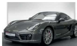
Porsche Zentrum Oldenburg

Porsche Cayman S mit PDK , 239 kW (325 PS), EZ 07/15, 13.828 km, dunkelblau-metallic, Serienausstattung/Sitze Alcantara® schwarz, Porsche Communication Management (PCM) inkl. Navigationsmodul und universeller Audio-Schnittstelle, ParkAssistent vorne und hinten, BOSE® Surround Sound-System, HomeLink® (Garagentoröffner), Sportabgasanlage, Sport Chrono Paket, SportDesign Lenkrad mit Schaltpaddles, 20-Zoll Carrera S Rad lackiert in Platinum (seidenglanz) u. v. m., EUR 65.900,-