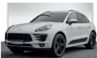
Porsche Zentrum Oldenburg

Porsche 911 Carrera 4 Cabriolet mit PDK , 254 kW (345 PS), EZ 05/10, 74.250 km, meteorgrau-metallic, Lederausstattung inkl. Sitze schwarz, ParkAssistent hinten, BOSE® Surround Sound-System, Telefonmodul, automatisch abdblendende Innen-/Außenspiegel mit integriertem Regensensor, dynamisches Kurvenlicht, Fußmatten, Navigationsmodul, Sitzheizung, Sportsitze, universelle Audio-Schnittstelle, Vorrüstung Vehicle Tracking System, 19-Zoll Carrera Sport Rad u. v. m., EUR 66.950,-