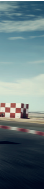
Elegant und exklusiv. Porsche Driver's Selection.