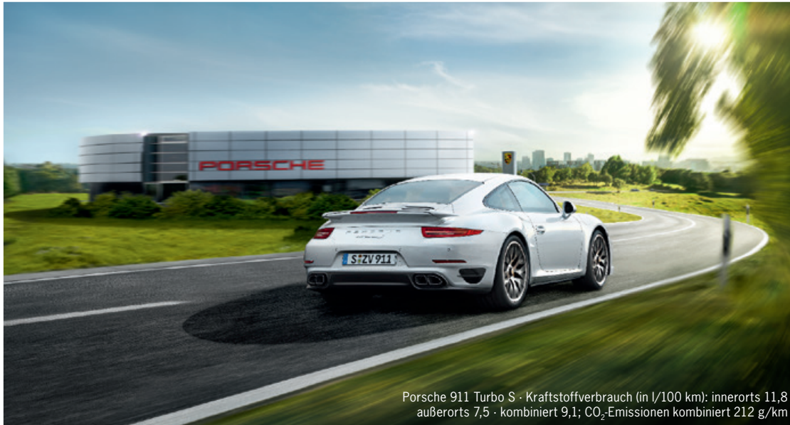
Porsche 911 Turbo S · Kraftstoffverbrauch (in l/100 km): innerorts 11,8 außerorts 7,5 · kombiniert 9,1; CO 2 -Emissionen kombiniert 212 g/km