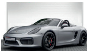
Porsche Zentrum Oldenburg

Porsche Boxster Spyder , 276 kW (375 PS), EZ 06/16, 1.177 km, rhodium-silbermetallic, Lederausstattung mit Alcantara® (schwarz) in Verbindung mit Ziernähten in Kontrastfarbe Rot, 6-Gang-Schaltgetriebe, Audiosystem CDR Plus mit Sound Package Plus, Handylvorbereitung, Klimaanlage manuell, Netzwindstrotz, Raucherpaket, Sicherheitsgurte indischrot, Türöffnerschlaufen in Ziernahfarbe, Vollschalenitze, 20-Zoll Boxster Spyder Design Rad lackiert in Schwarz (seidenglanz) u. v. m., MwSt. ausweisbar, EUR 112.900,-