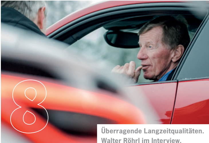
Überragende Langzeitqualitäten. Walter Röhrl im Interview.