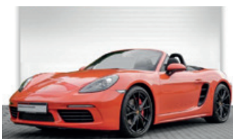
Porsche Zentrum Oldenburg

Porsche Boxster Spyder , 276 kW (375 PS), EZ 06/16, 1.177 km, rhodium-silbermetallic, Lederausstattung mit Alcantara® (schwarz) in Verbindung mit Ziernähten in Kontrastfarbe Rot, 6-Gang-Schaltgetriebe, Audiosystem CDR Plus mit Sound Package Plus, Handylvorbereitung, Klimaanlage manuell, Netzwindstrotz, Raucherpaket, Sicherheitsgurte indischrot, Türöffnerschlaufen in Ziernahfarbe, Vollschalenitze, 20-Zoll Boxster Spyder Design Rad lackiert in Schwarz (seidenglanz) u. v. m., MwSt. ausweisbar, EUR 112.900,-