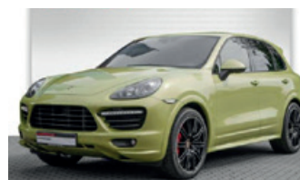
Porsche Zentrum Oldenburg

Porsche Panamera Diesel , 184 kW (250 PS), EZ 11/13, 58.446 km, achatgrau-metallic, Lederausstattung achatgrau, LED-Scheinwerfer inkl. Porsche Dynamic Light System Plus (PDLS+), Porsche Communication Management (PCM) inkl. Navigationsmodul, ParkAssistent vorne und hinten inkl. Rückfahrkamera und Surround View, BOSE® Surround Sound-System, 20-Zoll Panamera Sport Rad lackiert in Schwarz (hochglanz), ParkAssistent u. v. m., MwSt. ausweisbar, EUR 56.850,-