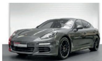
Porsche Zentrum Oldenburg

Porsche Macan S Diesel , 190 kW (258 PS), EZ 04/14, 30.175 km, weiß, Serienausstattung Interieur schwarz, Bi-Xenon-Scheinwerfer inkl. Porsche Dynamic Light System Plus (PDLS+), Porsche Communication Management (PCM), ParkAssistent vorne und hinten inkl. Rückfahrkamera, BOSE® Surround Sound-System, Luftfederung mit Niveau-regulierung und Höhenverstellung inkl. Porsche Active Suspension Management (PASM), 21-Zoll 911 Turbo Design Rad u. v. m., EUR 62.950,-