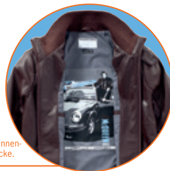
Steve McQueen Artpatch auf der Innenseite der Lederjacke.